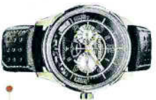
CHIAVE AL POLSO La chiave dell'auto? Al polso, con l'orologio Jaeger-LeCoultre che apre l'Aston Martin

Orologi dichiaratamente ispirati ad auto di lusso. In qualche caso riservati in esclusiva ai proprietari delle raffinate vetture. O perfino trasformati in chiavi elettroniche