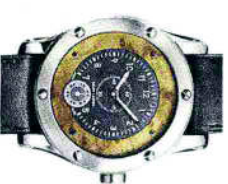
DAL CRUSCOTTO Ha il quadrante in radica d'olmo il modello Ralph Lauren che cita la Bugatti 57 SC Atlantic coupé